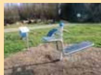
Bauch-/Rückenstation: trainiert Bauch- und die gesamte Rückenstreckmuskulatur