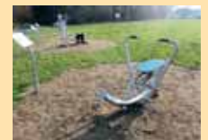
Ruderggerät: trainiert Arme, Schultern, Rücken, Beine.