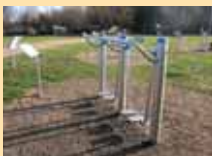
Beintrainer: kräftigt die Beinmuskulatur und fördert die Beweglichkeit

„Luft und Bewegung sind die eigentlichen geheimen Sanitätsräte“ – erkannte schon Theodor Fontane. Beide Gesundheitsfaktoren zusammen zu führen, ist uns mit sechs Trainingsgeräten unseres Bewegungsparcours gelungen. Neben dem Gespensterwald kann unser Ostseebad dann ein weiteres Alleinstellungsmerkmal für sich verbuchen, denn wo gibt es schon einen Outdoorgeräte-Park mit Meerblick. Finden kann man den Bewegungsparcours auf der Strandkorbwiese, hinter dem „Strandrestaurant“, am Europäischen Radwanderweg E9. Die playfit-Geräte decken alle Bewegungsfunktionen ab: Kraft, Kreislauf, Beweglichkeit/Dehnen, Koordination/Gleichgewicht, Auflockerung und Muskeltraining. Unsere Geräte sind nach physiotherapeutischen Maßstäben ausgewählt und repräsentieren einen Querschnitt der Trainingsmöglichkeiten.