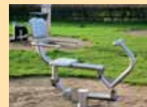
Beinpresse: trainiert Bein-, Gesäß-, Bauch- und Rumpfmuskulatur