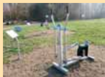
Ganzkörpertrainer: aktiviert und kräftigt alle wichtigen Muskelgruppen