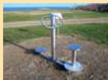
Rückentrainer: fördert die Beweglichkeit der Wirbelsäule, lockert die Rücken- und trainiert die Bauchmuskulatur